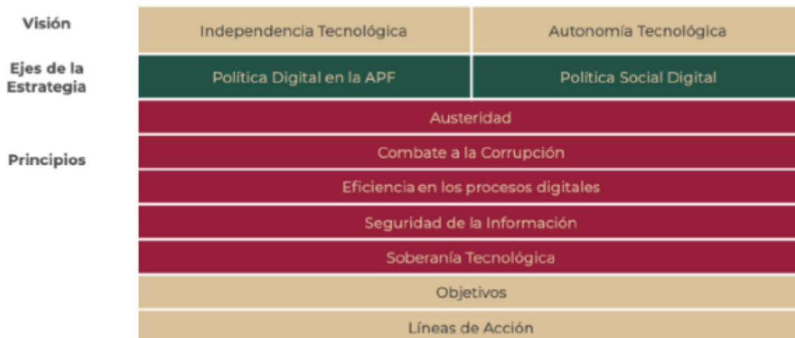
Figura 3. Marco estructural de la EDN

La siguiente figura esquematiza dicho marco estructural: